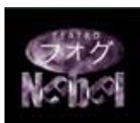
Compania Nebel Teatre