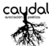
Associació poètica Caudal